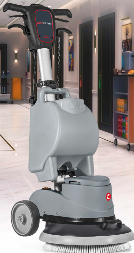
CM43 F DS Largeur de travail: 430 mm Alimentation: câble Transmission: engrenages

CM43 F DS est la monobrosse professionnelle idéale pour les entreprises de nettoyage et pour les sols des hôtels et du secteur Ho.Re.Ca. en général, mais aussi de la grande distribution et des transports.