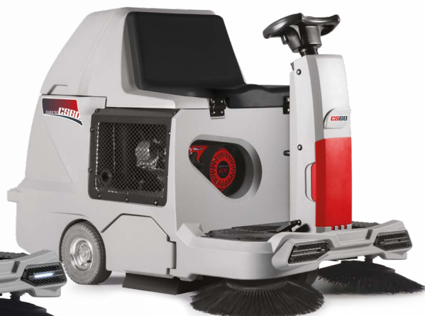
CS60 Hybrid Version batterie et moteur à combustion interne