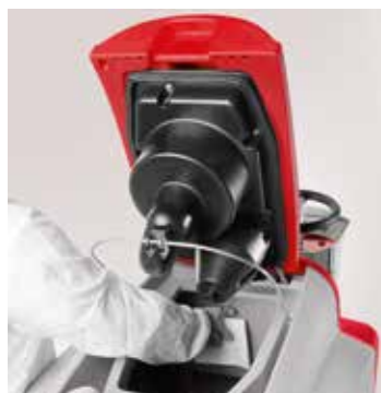
Sanification complète des réservoirs