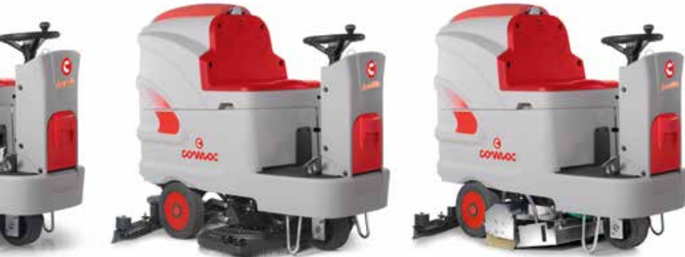
Innova 100 B

Un simple dispositif (en option) permet de remplir rapidement le réservoir d'eau propre, sans la présence de l'opérateur