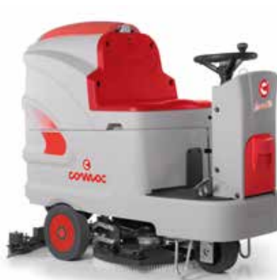
Innova 60 B

Le carter et le suceur sont descendus/montés simplement à l'aide de 2 leviers