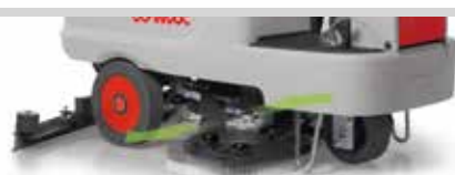
Innova 70 S

Les Innova 65/75/85 incorporent un système qui permet de régler la piste de travail de 65 à 85 cm (pour en savoir plus, s'adresser au service après-vente COMAC)