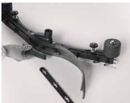
Remplacement aisé des bavettes sans outil sur le carter exclusif Comac (brevet en instance)