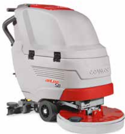
Antea 50 E/B/BT