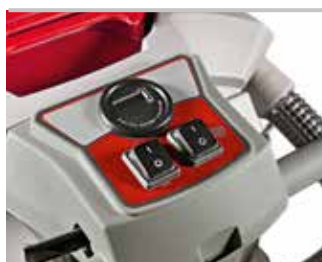
Panneau de commande version E