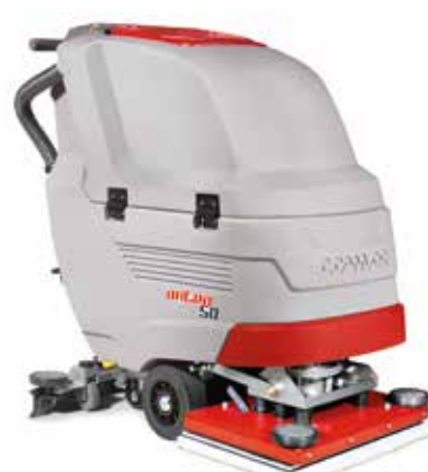
Antea 50 BTO Orbital