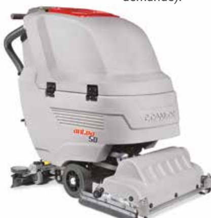
Antea 50 BTS