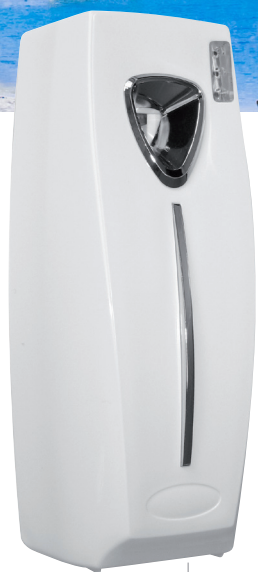
8 33 522